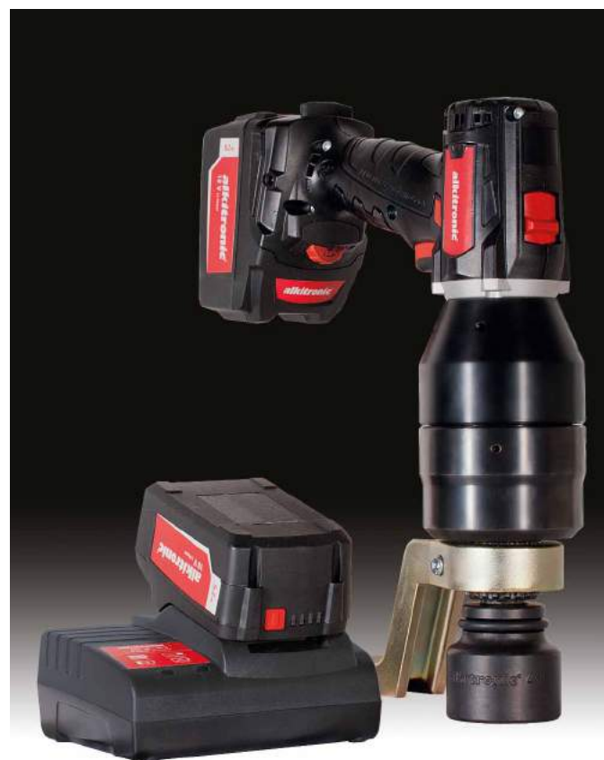
Tableau technique: Modèles alkitronic® EA