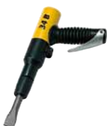
34 B Burin