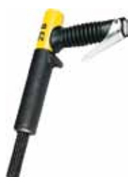
23 B Aiguilles