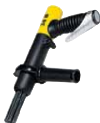
34 B Aiguilles