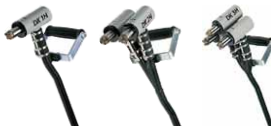
DK 1 H