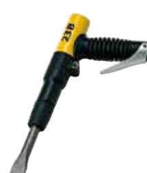
23 B Burin