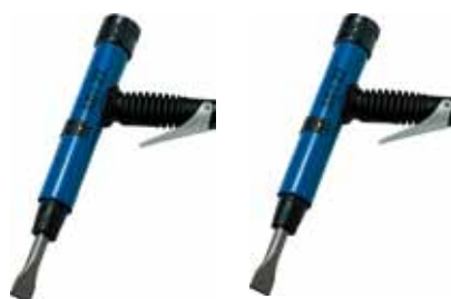
MH 23 Burin