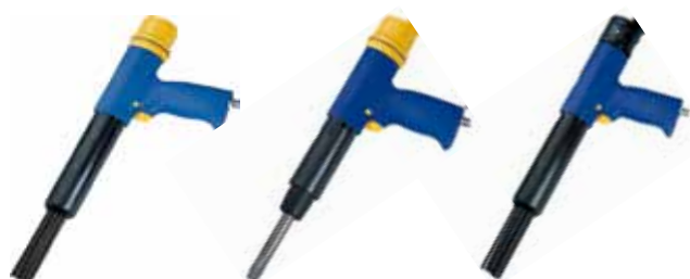
NP 23 K Aiguilles