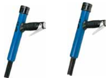
NP 23 Aiguilles