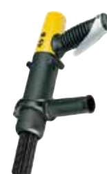
45 B Aiguilles