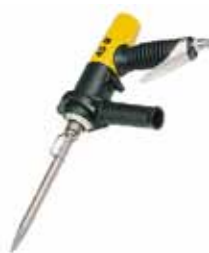
45 BG Burin